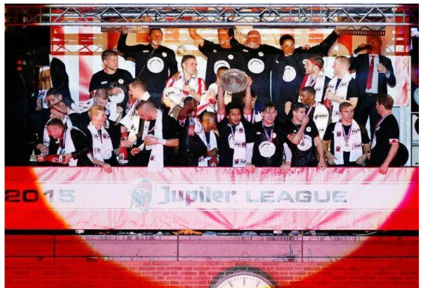
Sparta na kampioenschap Jupiler League