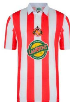
Thuisshirt AFC Sunderland

Tussen 1909 en 1915 werd Sparta vijf keer landskampioen! In 1916 kreeg de club een nieuw stadion: Het Kasteel. Dit stadion kreeg die naam door de twee torentjes op het gebouw. Het werd een belangrijk symbool van Sparta, en zelfs de Koninklijke Familie kwam hier wedstrijden kijken.