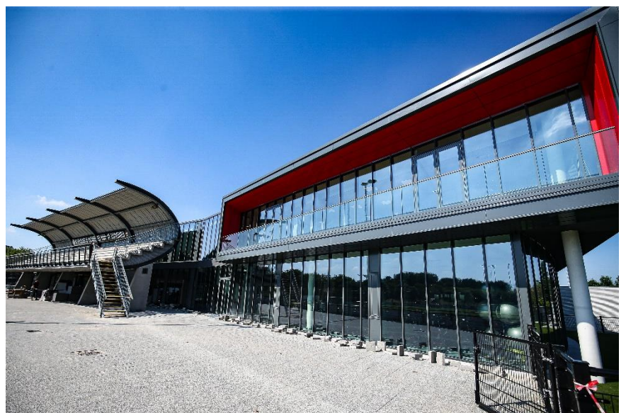
Foto Nieuw-Terbregge na renovatie

De jeugdteams maken gebruik van de faciliteiten op Sportcomplex Nieuw Terbregge, dat recent is gerenoveerd om een optimale leeromgeving te bieden. De renovatie duurde ongeveer 1,5 jaar, maar het resultaat is fantastisch. Dit complex beschikt over meerdere velden en moderne trainingsfaciliteiten die voldoen aan de eisen van de hedendaagse jeugdopleiding.