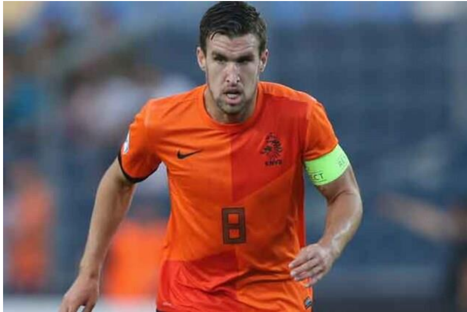
Kevin Strootman voor het Nederlands Elftal