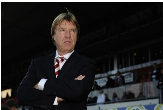
Aad de Mos