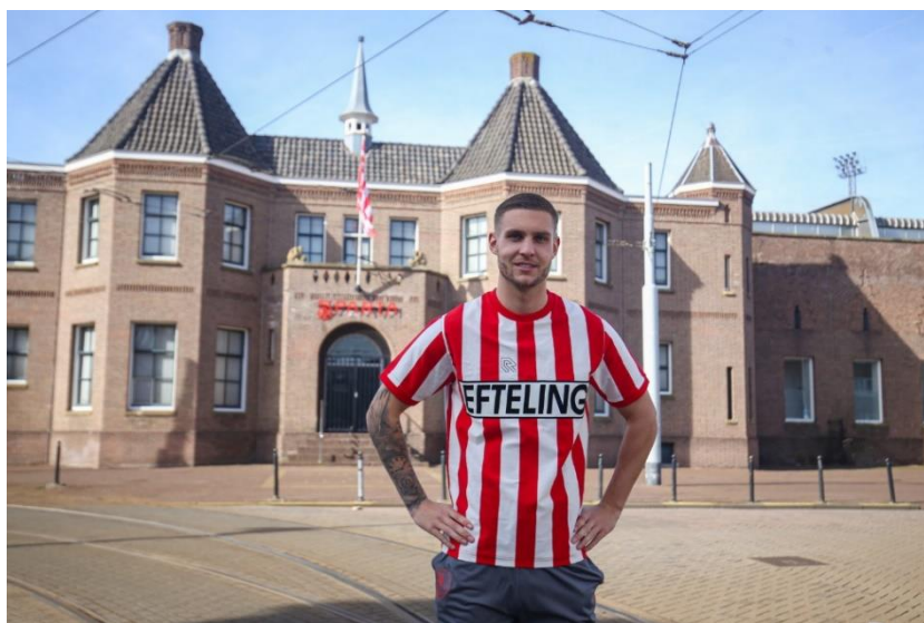
Thuistenuie Sparta x Efteling

Het thuistenuie van Sparta lijkt eigenlijk ieder seizoen wel op elkaar. Deze heeft altijd de rood-witte banen, en alleen de details zullen hierin anders zijn, zoals shirtsponsors, een kraagje/ knoopje etc.