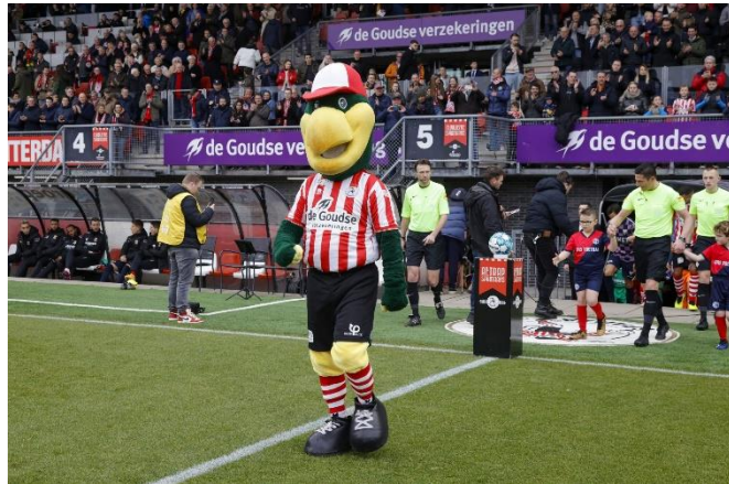
Sparta-Piet tijdens de opkomst