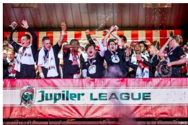
Kampioenschap Sparta 2016

Sparta werkte hard om weer terug te komen op het hoogste niveau. In 2005 lukte het: Sparta promoveerde naar de Eredivisie! Maar het bleef moeilijk en in 2010 degradeerde de club opnieuw. Promotie volgde in 2016 na een kampioenschap in de eerste divisie, maar degradeerde helaas in 2018 weer. Dit was gelukkig niet voor lang, Sparta promoveerde namelijk een jaar later weer naar het hoogste niveau.