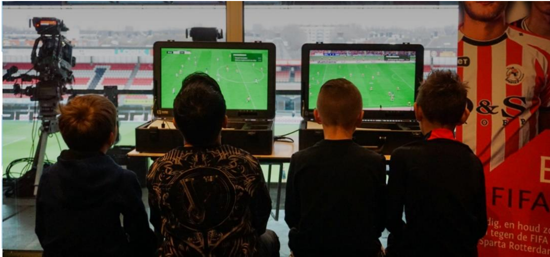
Kinderfeestje op z'n Spartaans

Als lid van de kidsclub is het ook mogelijk om je kinderfeestje op z'n Spartaans te geven. Dat is natuurlijk het allerleukste kinderfeestje wat je maar kunt bedenken! Samen met al jouw vriendjes en/ of vriendinnetjes kun je EAFC spelen in de eLoge, en dat met een van de Sparta eSporters. Daarna volgt er nog een leuke Sparta Rotterdam Quiz! En niet te missen, voor de jarige natuurlijk een cadeautje. Dit kinderfeestje duurt in totaal 2 uur, en is mogelijk op doordeweekse dagen, niet in het weekend.