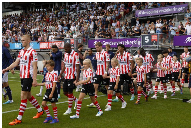
Foto tijdens de Line-up van Sparta-Feyenoord