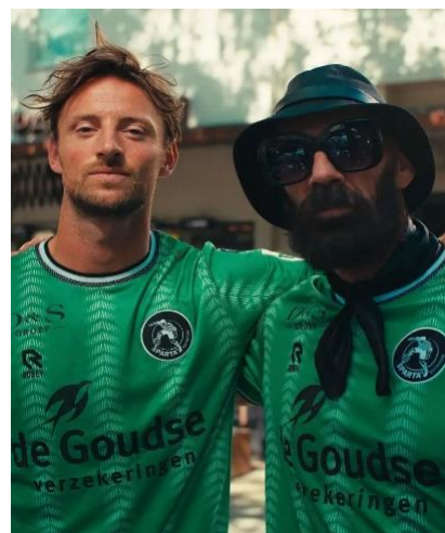
Ode aan de stad

Het alternatieve uitshirt, ofwel derde tenue is een ode aan de stad. Om die reden is het tenue in stijl van de kleuren van de Rotterdamse vlag. Het voetbalshirt is groen en bevat een design van verticale banen. Deze banen hebben dezelfde positie als op het thuisshirt, maar hebben een uniek zigzagpatroon.