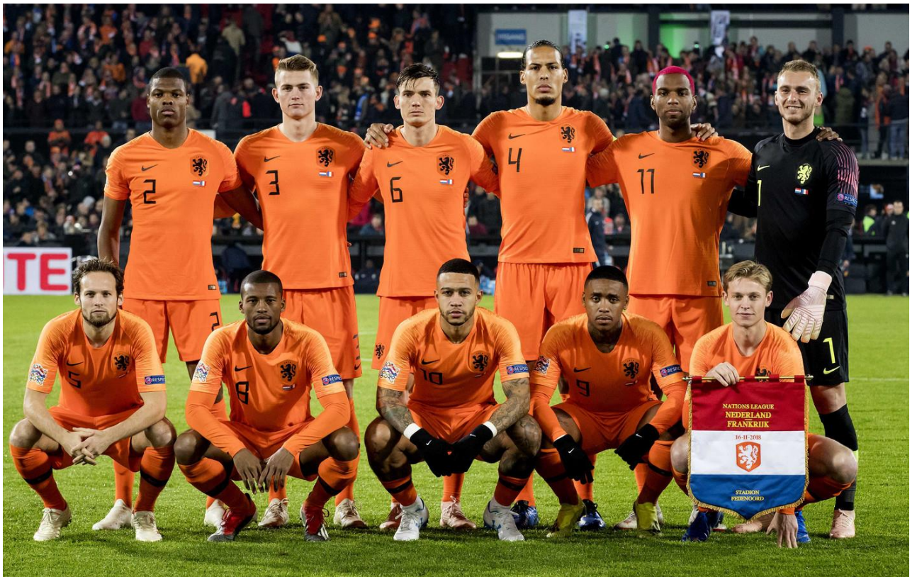
4 Spelers uit de Sparta Jeugdopleiding in het Nederlands Elftal

(2: Denzel Dumfries, 6: Marten de Roon, 8: Georgino Wijnaldum en 10: Memphis Depay)