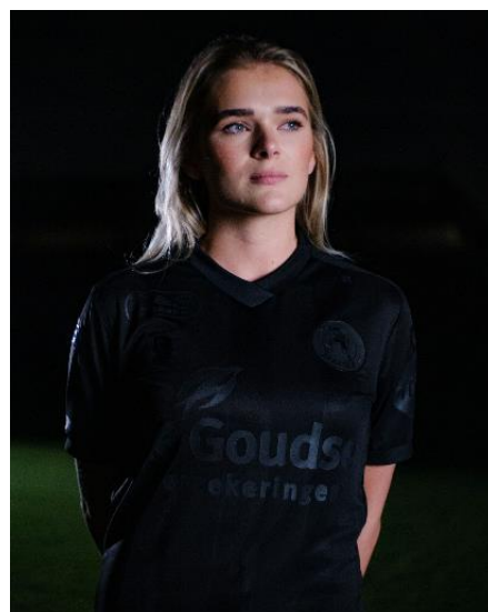
Ode aan de Nacht

Een Ode aan de Nacht brengen kan onmogelijk in een andere kleur dan zwart. Het derde tenue van Sparta Rotterdam is dan ook volledig zwart, inclusief de logo's op het tenue, de handtekening van Jules Deelder en het Spartaans gedicht op een zwarte badge.