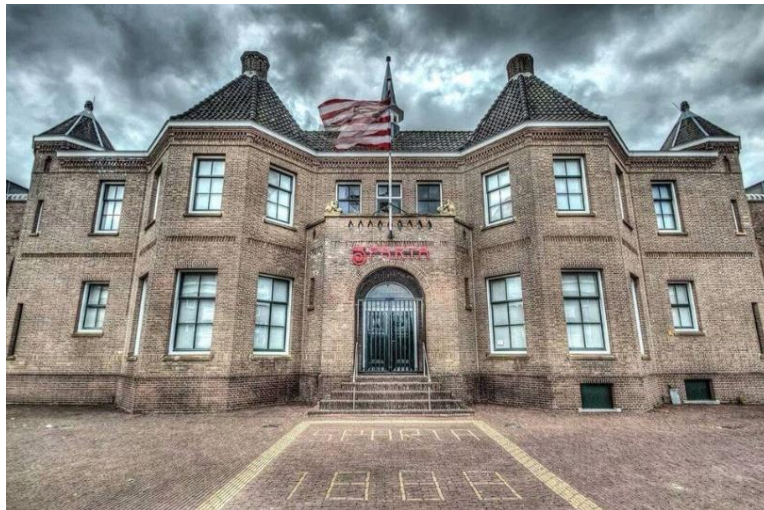
Sparta Stadion Het Kasteel

Voor elke thuiswedstrijd wordt volgens traditie de Sparta Marsch gedraaid, een clublied dat al sinds 1909 bij de club hoort. Dit zorgt voor kippenvelmomenten en versterkt het gevoel van trots en verbondenheid binnen Het Kasteel.