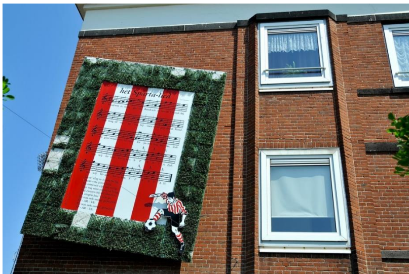
De Sparta Marsch, in de wijk Spangen, naast het Kasteel