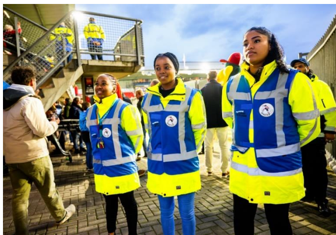
Deelnemers Rugdekking op wedstrijddag

Rugdekking biedt jongeren een waardevolle kans om werkervaring op te doen en zich te kwalificeren voor een baan in de beveiligings- en evenementenbranche. Met de behaalde certificaten vergroten zij hun kansen op de arbeidsmarkt en bouwen zij aan een sterke basis voor de toekomst.