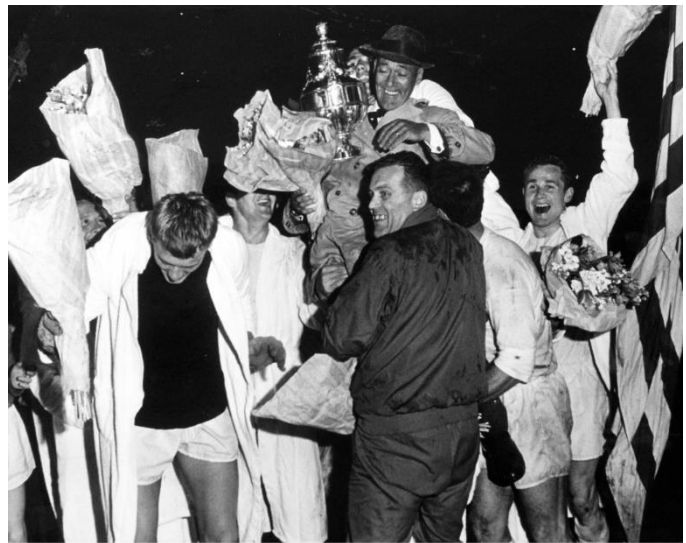
Sparta na het winnen van de KNVB-Beker