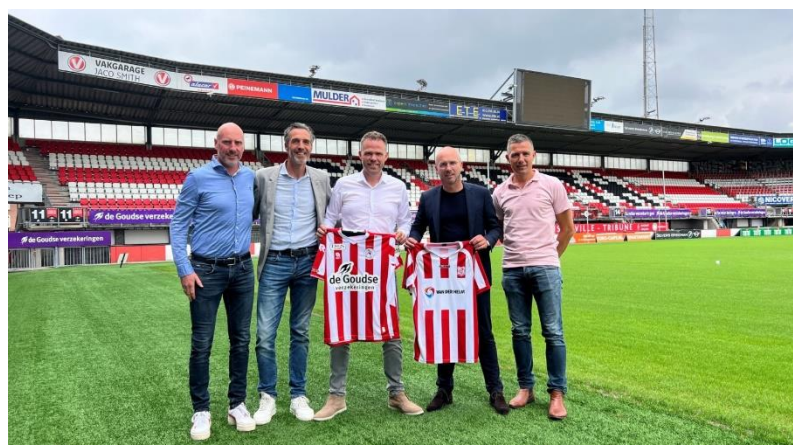
Samenwerking Sparta Rotterdam en SV Den Hoorn

Sparta Rotterdam heeft door de jaren heen samenwerkingen aangegaan met verschillende amateurverenigingen in de regio. Deze samenwerkingen richten zich op het delen van kennis en expertise, het organiseren van themabijeenkomsten en het faciliteren van gezamenlijke activiteiten.