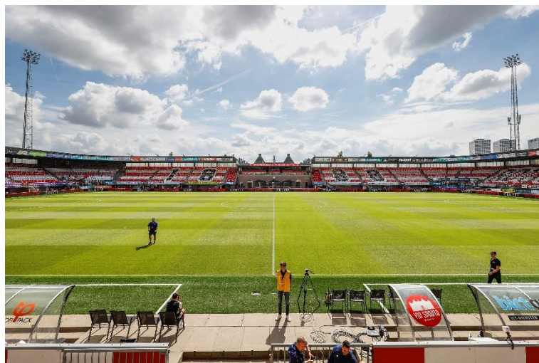
Op Het Kasteel, met zicht op de Kasteeltribune